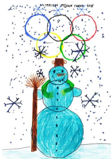
Jakub Pavlíček, 3.B